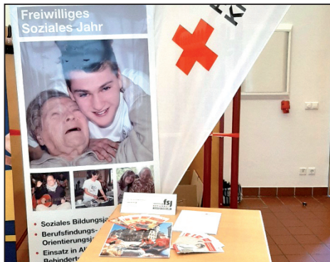
Lehrer, Schüler und Eltern hatten im Foyer die Möglichkeit, sich über die mitwirkenden Kooperationspartner zu informieren und Flyer mitzunehmen.

Beratungszentrum / Schwangerenberatung DRK Kreisverband Zwickauer Land e.V. Zwickauer Straße 51, 08451 Crimmitschau Telefon: 03762-94 54 112, E-Mail an: beratung@drk-zwickauer-land.de http://www.drk-zwickauer-land.de